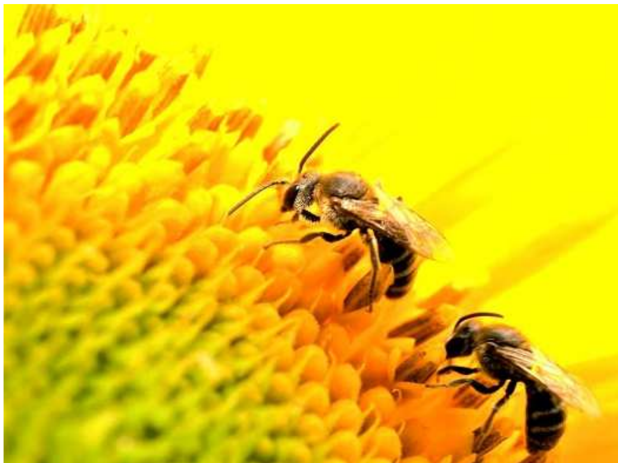
[2020年6月14日（日） 枚方市市民の森]